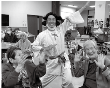
寿製菓「白兔一座」訪問